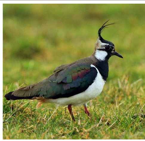
Kiebitz-Männchen haben einen längeren Federschopf als Weibchen und sind kontrastreicher gezeichnet