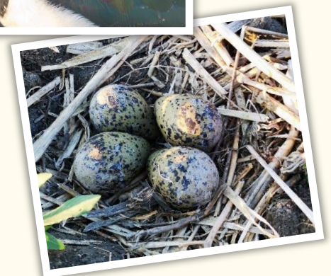
Kiebitz-Gelege haben meist 4 Eier