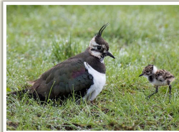
Kiebitz-Mutter nimmt Junges unter ihre Fittiche

Die Jungvögel sind vier Wochen lang flugunfähig , müssen in dieser Zeit aber oft erst zu Fuß in nahrungsreiche, ungestörte Flächen abwandern.